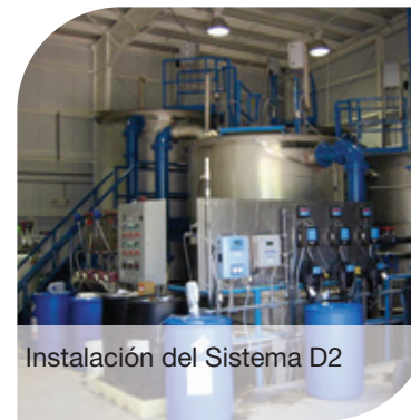
Instalación del Sistema D2

El sistema de D2 está disponible en unidades de paquete de acero inoxidable (Tanques) o, para mayores flujos, varios módulos de 50 pies cuadrados son instalados en tanques de concreto. Los mecanismos internos se envían en secciones fáciles para ser ensambladas in situ. Por lo general se suministran controles avanzados SCADA como parte del diseño del sistema. Resultados superiores y rendimiento uniforme son los sellos característicos del Sistema DynaSand D2®. Menores costos de operación y menos inversión de capital hacen que el Sistema DynaSand D2® sea una alternativa atractiva y económica a la tecnología de membrana de baja presión.