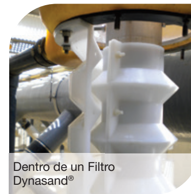
Dentro de un Filtro Dynasand®